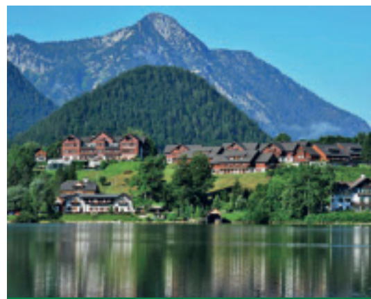
Der Sieger: Mond-Holiday Hotel Grundlsee

Rund 25.000 Betriebe im Alpenraum stehen auf Tiscover.com zur Auswahl. Das Angebot reicht dabei vom familiären Bauernhof bis hin zum luxuriösen Fünf-Stern-Hotel. Für das Jahr 2009 hat Tiscover nun die beliebtesten Unterkünfte in den unterschiedlichen Kategorien zusammengestellt. Ausschlaggebend für das Ranking war – neben der Anzahl der Online-Buchungen – die Menge und Qualität der Gästebewertungen. Neben der gebotenen Ausstattung und Verpflegung bewerten die Nutzer auf Tiscover.com auch die Servicequalität und das Preis-Leistungsverhältnis der Unterkunft. Besonders beliebt bei den Tiscover-Nutzern waren 2009 die Thermenhotels, weshalb diese Unterkünfte in einer eigenständigen Kategorie zusammengefasst wurden.