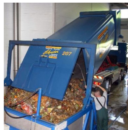
Lastwagen liefern die gesammelten Speisereste in grossen Containern zur weiteren Verarbeitung an.